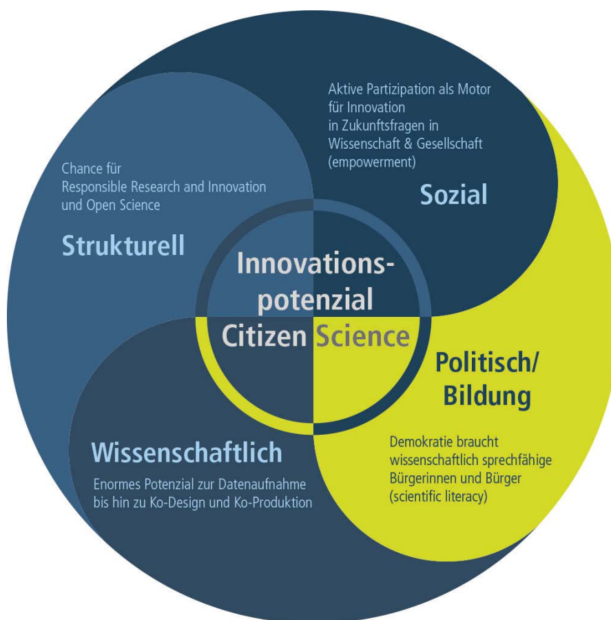
Abbildung 1 Innovationspotenziale von Citizen Science.

Citizen Science bedeutet Engagement von Bürgerinnen und Bürgern in der konkreten Bearbeitung wissenschaftlicher Themen. Diese sind vielfach von hoher gesellschaftlicher Relevanz. Als Form der aktiven Teilhabe der Öffentlichkeit bei Problemlösungsprozessen erlangt Citizen Science in Deutschland verstärkt sowohl wissenschaftliche, als auch gesellschaftliche und politische Bedeutung. Dies bietet Chancen, das strukturelle, soziale, wissenschaftliche und politische Innovationspotenzial von Citizen Science stärker in die Forschung zu integrieren (Abbildung 1).