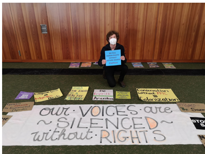
Aktion vor dem Plenarsaal zum Thema „menschenrechtsbasierter Ansatz“.

Besonders gespannt verfolgten wir gemeinsam mit anderen Jugenddelegierten aus den verschiedensten Ländern auch den Abschnitt 21 zum sogenannten „menschenrechtsbasierten Ansatz“. Der Gedanke ist einfach: Nur wenn Menschenrechte, insbesondere die Rechte von Indigenen und lokalen Gemeinschaften, gewährleistet sind, kann auch die Natur effektiv und legitim geschützt werden. Biodiversitätsschutz und Menschenrechte sind also eng verknüpft und müssen unbedingt im neuen Rahmenwerk gemeinsam verankert werden. Doch in Genf fand keine eingehende Diskussion dazu statt, mehrmals wurde die Thematik verschoben.