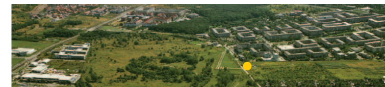
6_Erste Gestaltung des Jugendtreffs