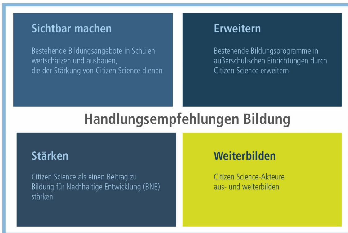
Abbildung 2 Zusammenfassung der Handlungsempfehlungen Bildung und Citizen Science.

Ziel ist es, Projekte und Aktivitäten zu fördern, die Bildungsarbeit an der Schnittstelle von Citizen Science und Umweltbildung, Bildung für Nachhaltige Entwicklung und Kommunikation verfolgen. Es sollen Aktivitäten sichtbar gemacht, erweitert, gestärkt und ausgebaut, werden, die relevant und notwendig für die praktische Umsetzung von Citizen Science und Bildung sind. Die Akteure sind aus- und weiterzubilden sowie Kriterien zur Sicherung von Standards in Citizen Science in der Bildung zu entwickeln, zu testen und anzuwenden (Abbildung 2).