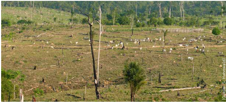
Regenwälder werden in Pará zuerst meist in Weiden umgewandelt.