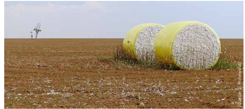
Baumwollballen in der ausgeräumten Agrarlandschaft Zentral-Brasiliens.