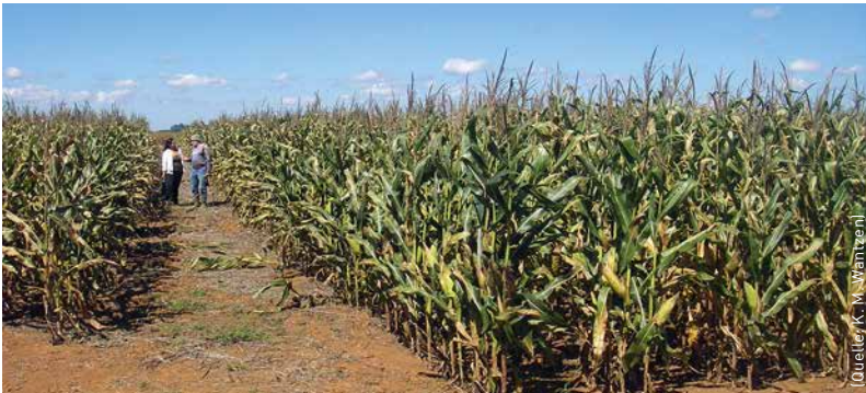
Bodenkohlenstoff-Anreicherungsversuche auf einem Maisfeld bei Campo Verde.

in Form eines palmtop-Computers nutzen können«, beschreibt Gerold seine Vision, die im Amazonasgebiet Realität werden soll und – in Variationen – in ganz Lateinamerika angewendet werden könnte.