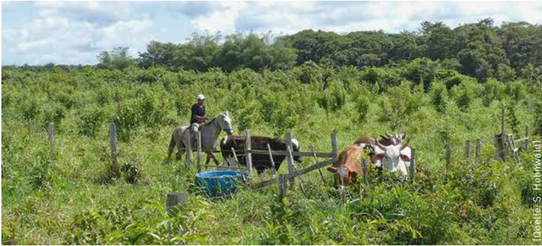
Artenreiche kombinierte Agro-Silvo-Pastorile Systeme helfen Kleinbauern, ihre Flächen nachhaltig zu bewirtschaften.

Satellitenbilddauswertungen zufolge wurden im Amazonasgebiet in den vergangenen 30 Jahren bis zu einem Viertel der Regenwälder gerodet. Die Baumstämme wurden verkauft, Rodungsflächen niedergebrannt, um Viehhaltung zu betreiben oder Soja, Mais und Baumwolle anzubauen.