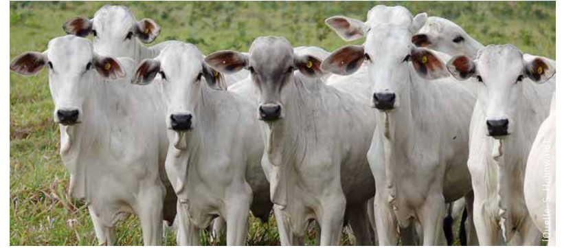
Die Rinderrasse Nelore wird wegen ihrer besseren Anpassung an das Tropenklima besonders auf großen Farmen eingesetzt.