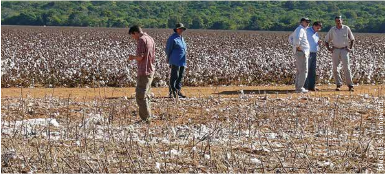
Diskussion zwischen Forschern und Farmern zu Auswirkungen des Klimawandels auf Baumwollerträge in Mato Grosso.

der Regenzeiten und höhere Variabilität der Niederschläge – davon wissen viele schon jetzt zu berichten. Welche Folgen die klimatischen Veränderungen auf die Erträge haben, wollen die Carbiocial-Forscher in weiteren Teilprojekten simulieren.