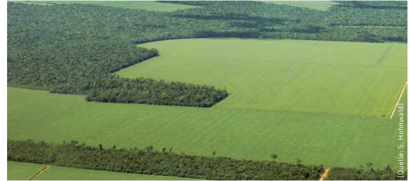
Intensiver Soja-Mais-Anbau im markanten Wechsel mit intakten Regenwäldern bei Sinop.

in zwei Untersuchungsgebieten nahe den Städten Sinop und Cuiabá. In Cuiabá begann in den 1970er Jahren die agrarwirtschaftliche Erschließung.