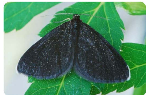
Schwarzspanner ( Odezia atrata )