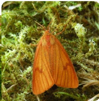
Weibchen deutlich dunkler und kleiner