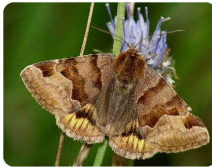
Braune Tageule ( Euclidia glyphica )