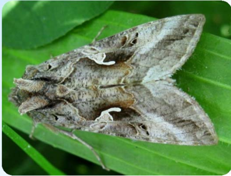
Gammaeule ( Autographa gamma )