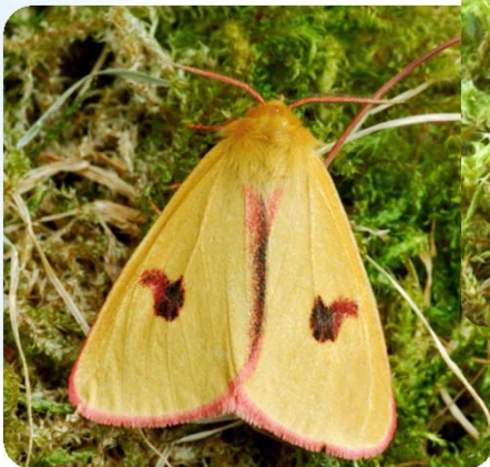
Rotrandbär ( Diacrisia sannio )