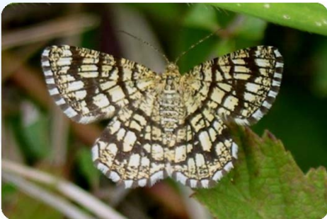
Gitterspanner ( Chiasmia clathrata )