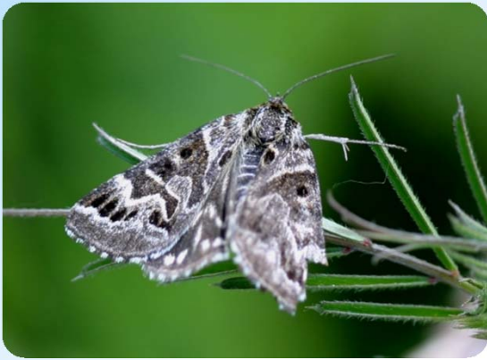
Scheck-Tageule ( Callistege mi )