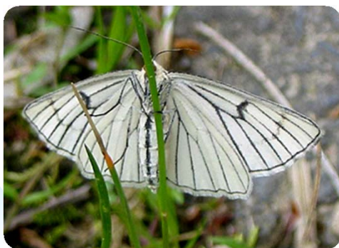
Hartheu-Spanner ( Siona lineata )