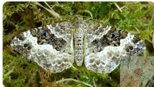
Labkrautspanner ( Epirrhoe alternata )