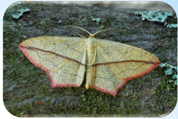
Ampferspanner ( Timandra comae )