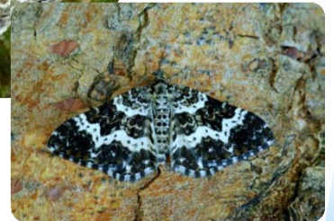
Leicht zu verwechseln mit der Art E. tristata (und weiteren seltenen Arten)