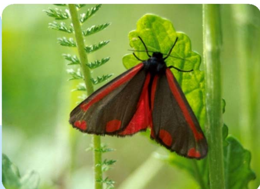
Jakobskrautbär ( Tyria jacobaeae )

Die vorliegende Tafel stellt eine Auswahl besonders häufiger tagaktiver Nachtfalter dar. Für die Gruppe der Widderchen ( Zygaenidae ) siehe www.tagfalter-monitoring.de (Links). Kompetente Hilfe bei Bestimmungsfragen finden Sie auch unter www.lepiforum.de