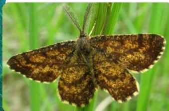
Männchen mit gefiederten Fühlern