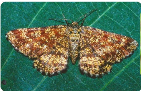
Heidespanner ( Ematurga atomaria )