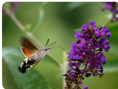
Taubenschwänzchen ( Macroglossum stellatarum )