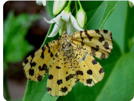
Pantherspanner ( Pseudopanthera macularia )