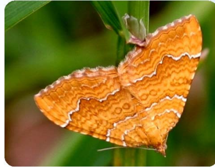
Ockergelber Blattspanner ( Camptogramma bilineata )