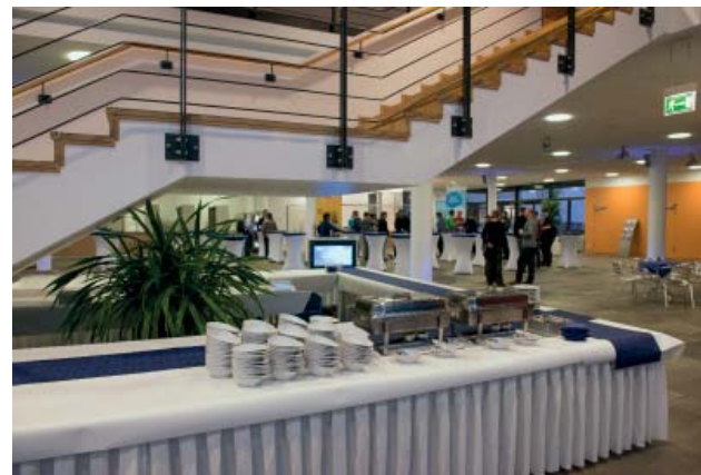
Das Foyer in einer möglichen Catering-Situation unter Nutzung der Freitreppe zu Saal 1 (Grundriss: UFZ)

Das Foyer kann vielfältig für Ausstellungen, Empfänge, Produktpräsentationen und Caterings genutzt werden. An das Foyer grenzt eine großzügige Terrasse. Weiterhin ist eine Küche mit Kochfeld, Kombidämpfer und Spülmaschine vorhanden. Das Cateringunternehmen ist frei wählbar. Bistrobestuhlung und Buffettische stehen in begrenzter Anzahl zur Verfügung. Im Foyer gibt es zudem einen Empfangs- und Garderobenbereich.