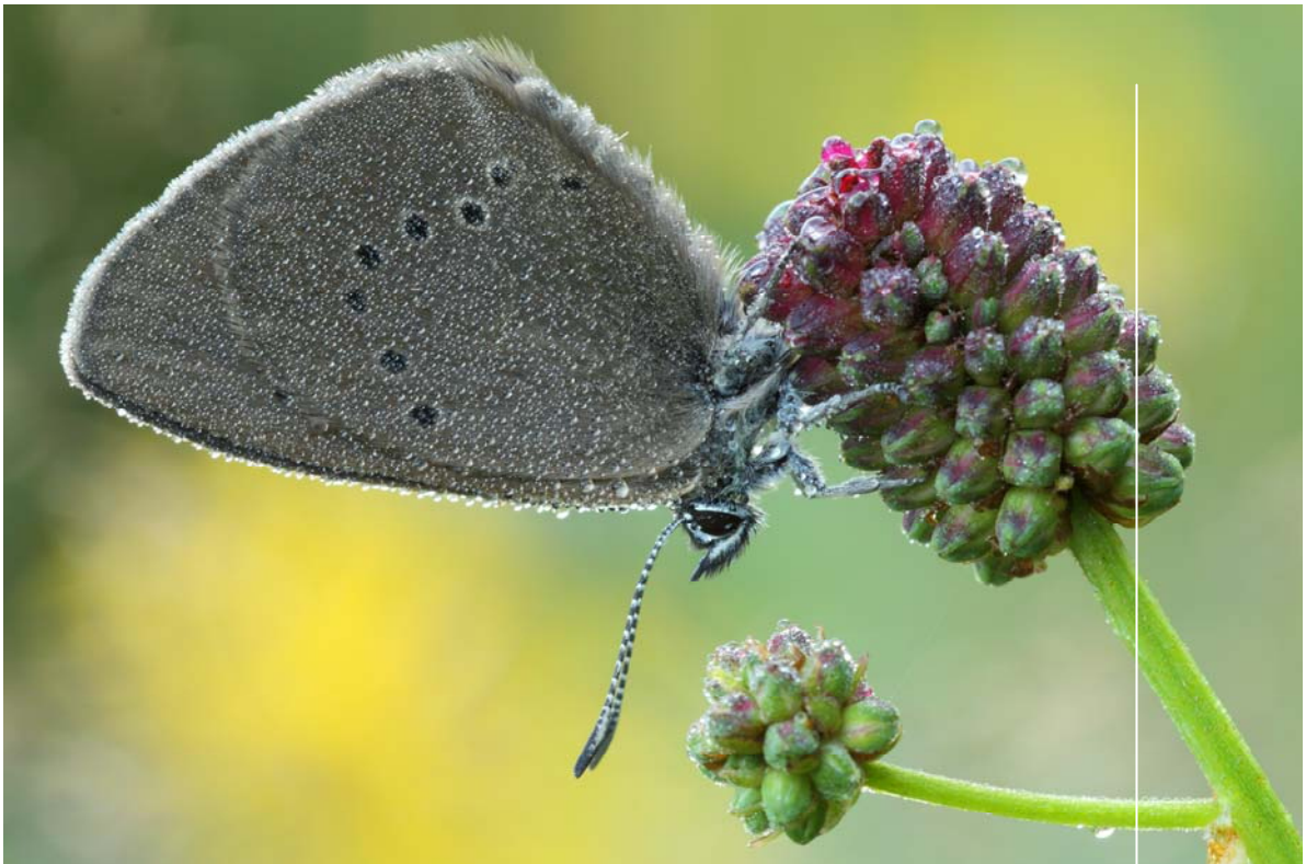
Dunkler Wiesenknopf-Ameisenbläuling

Dunkler Wiesenknopf-Ameisenbläuling ( Maculinea nausithous ) und Heller Wiesenknopf-Ameisenbläuling ( Maculinea teleius )